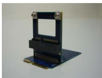
JET-5335B Full To Half