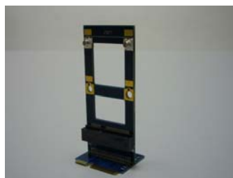
JET-5335C Half To Full