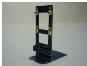
JET-5335A Full To Full