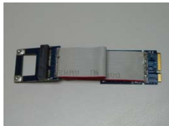
JET-5335F Full To Half