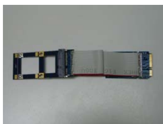
JET-5335E Full To Full