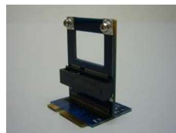
JET-5335D Half To Half